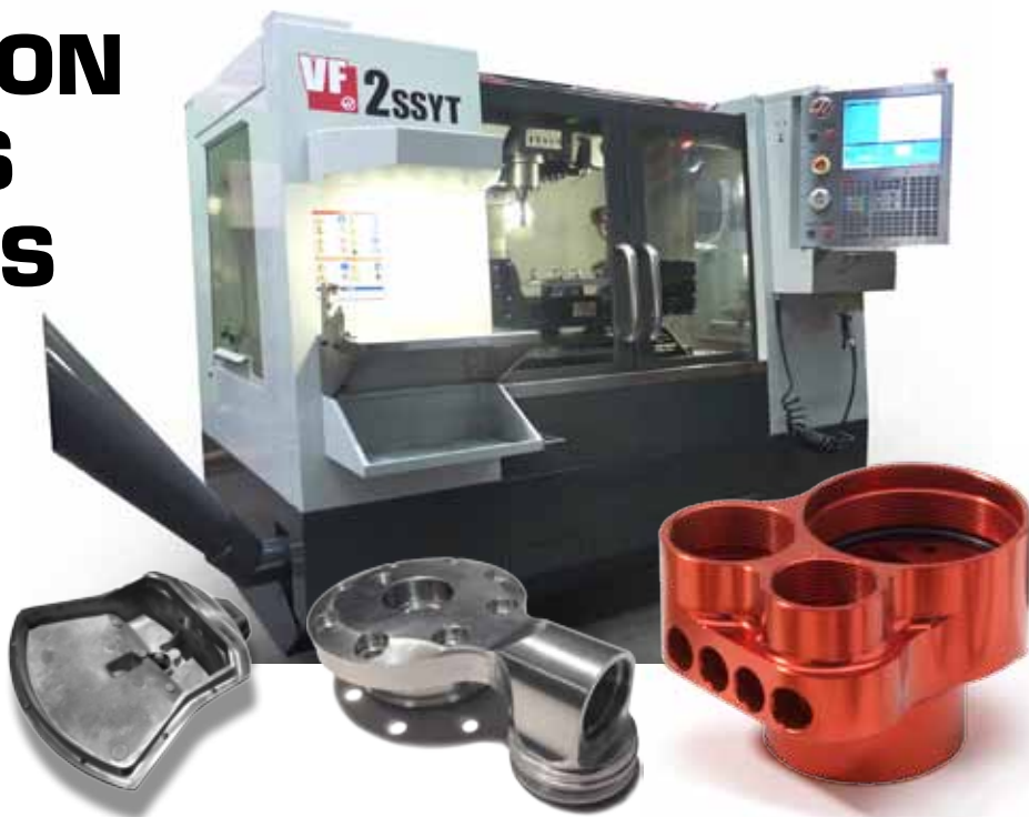
Brut de fonderie usiné

Dans le but d'étoffer notre offre, nous venons d'investir dans un centre d'usinage 5 axes HAAS permettant d'usiner des pièces plus techniques en tous matériaux : acier, aluminium, laiton, matières plastiques... Couplé au logiciel "ESPRIT", autre acquisition récente, nous pouvons désormais réaliser tout type d'usinage 3D. Cette machine prend également en charge les pièces de fonderie dans le cadre de reprises d'usinage : si les bruts présentent des irrégularités, pas de problème : le palpeur Renishaw permet de mesurer chaque pièce avant de l'usiner afin d'obtenir un produit fini précis malgré les variations des ébauches.