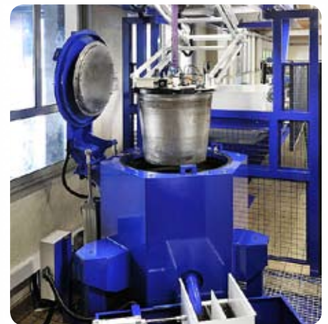
Nouvelle ligne d'essorage

• 2 nouvelles ENC permettant le décolletage de pièces jusqu'au Ø16.